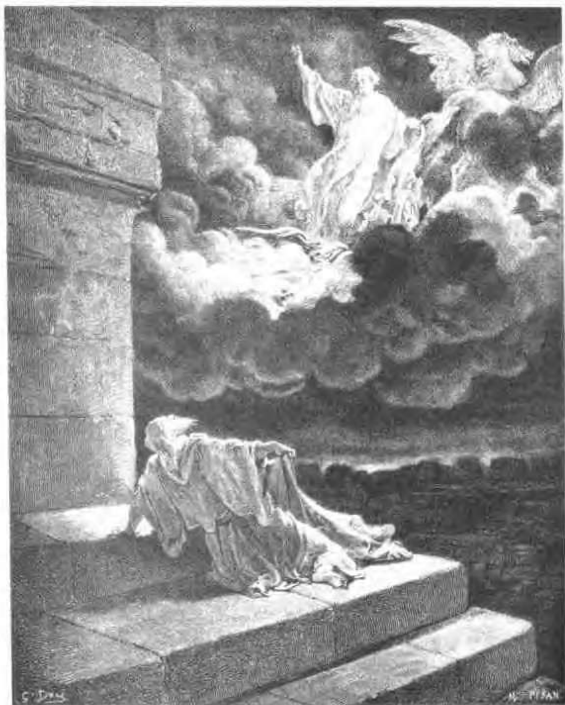
以利亞乘火車升天而去。