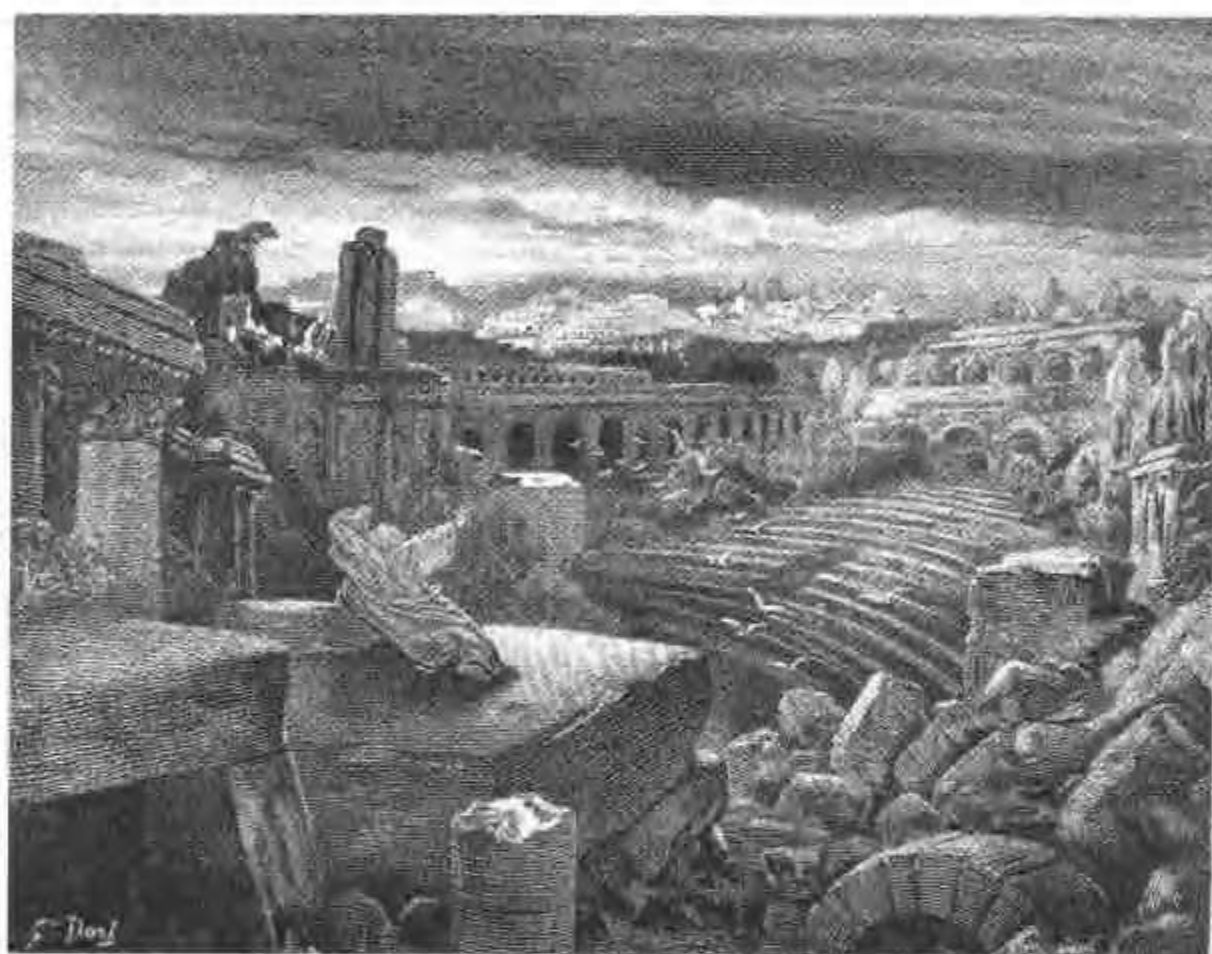
以賽亞望着被毀的巴比倫城。