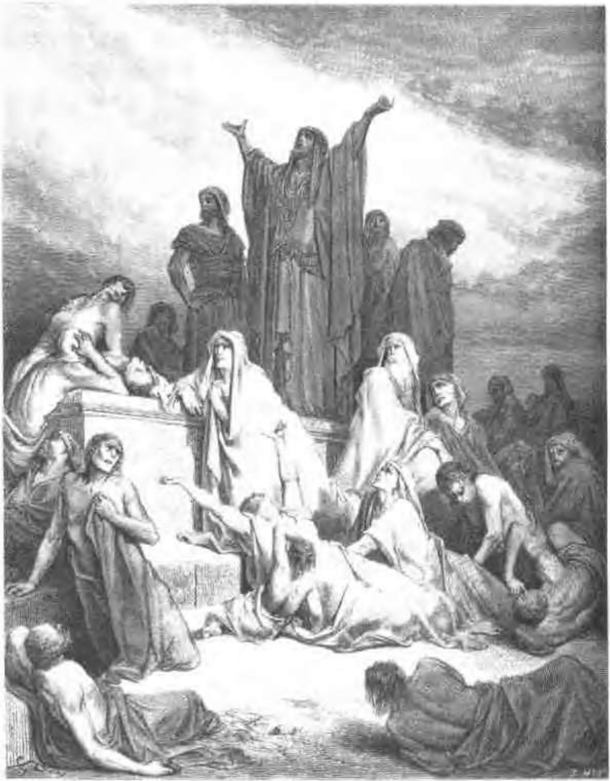
耶路撒冷遭受瘟疫。