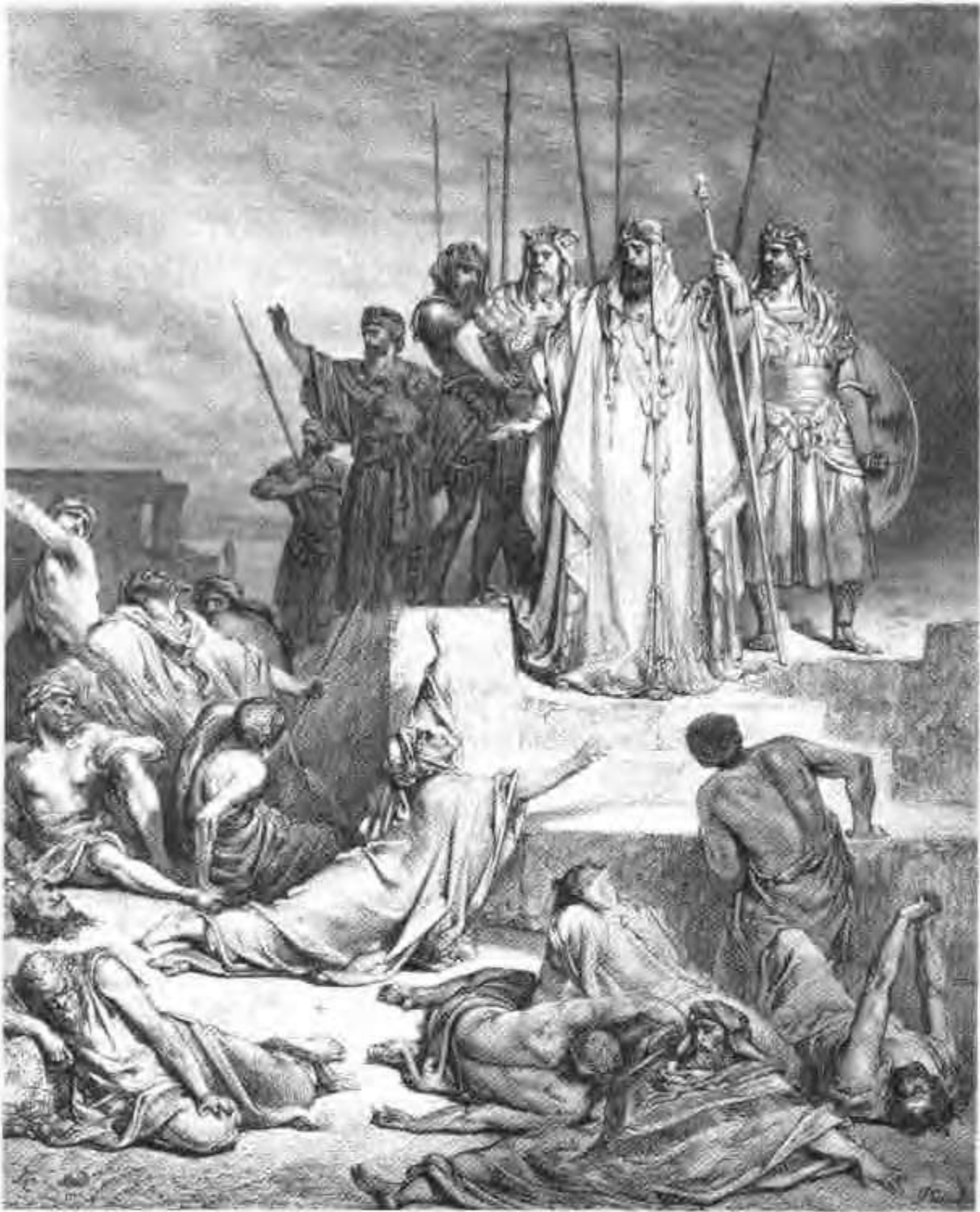
撒玛利亚陷于饥荒之中。