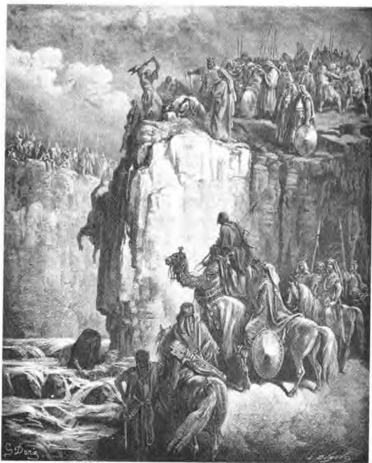
以利亞在基順河邊殺死巴力的先知。