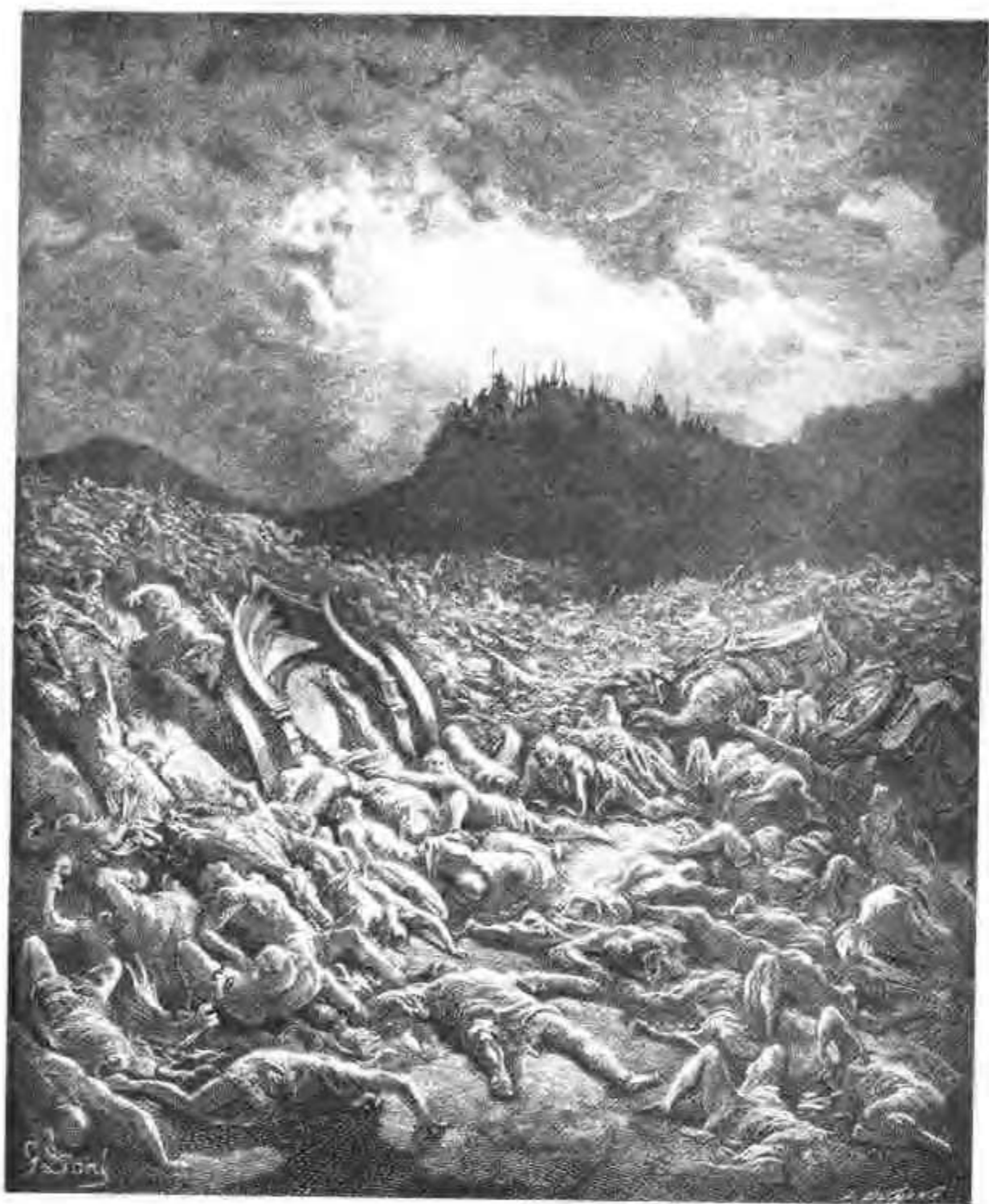
摩押人的军队尸体遍野。