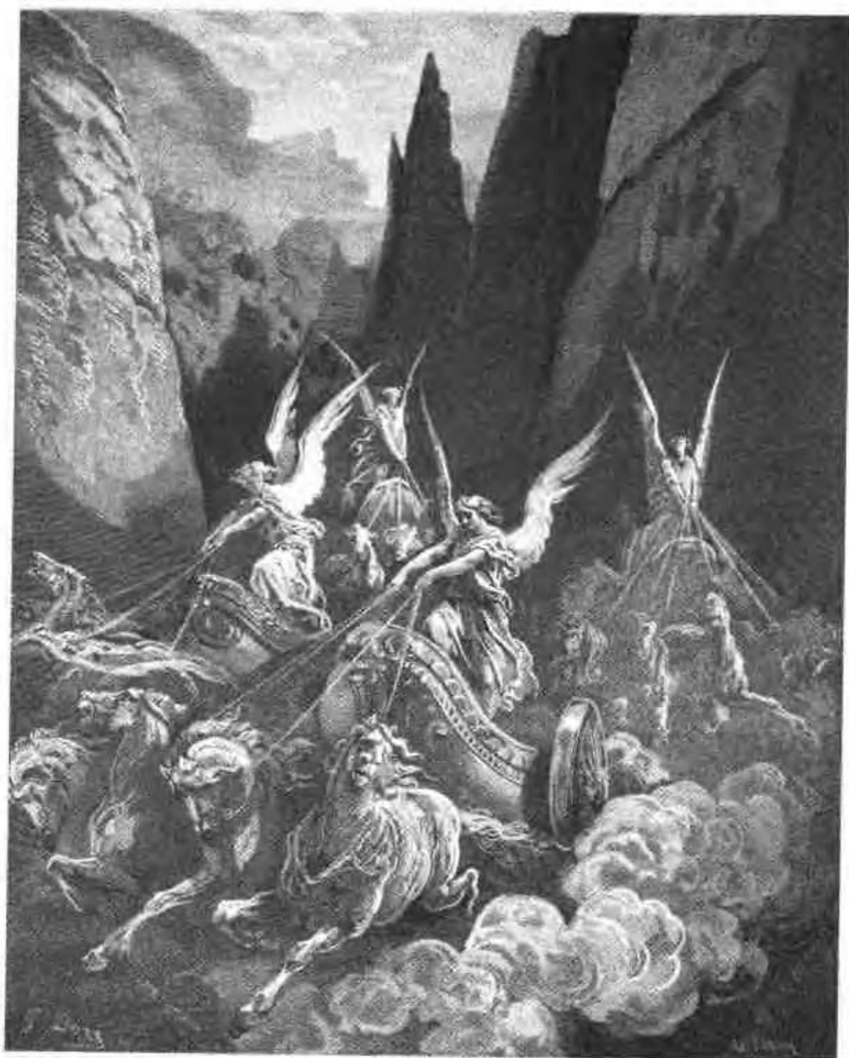
撒迦利亚看到四辆马车从两山中间出来。