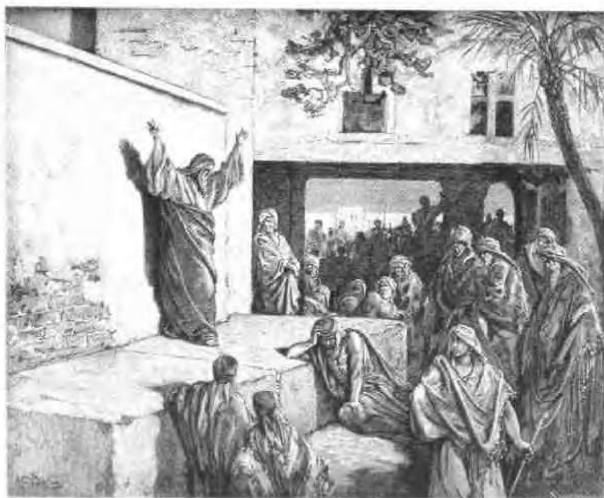
弥迦劝说以色列人悔改。