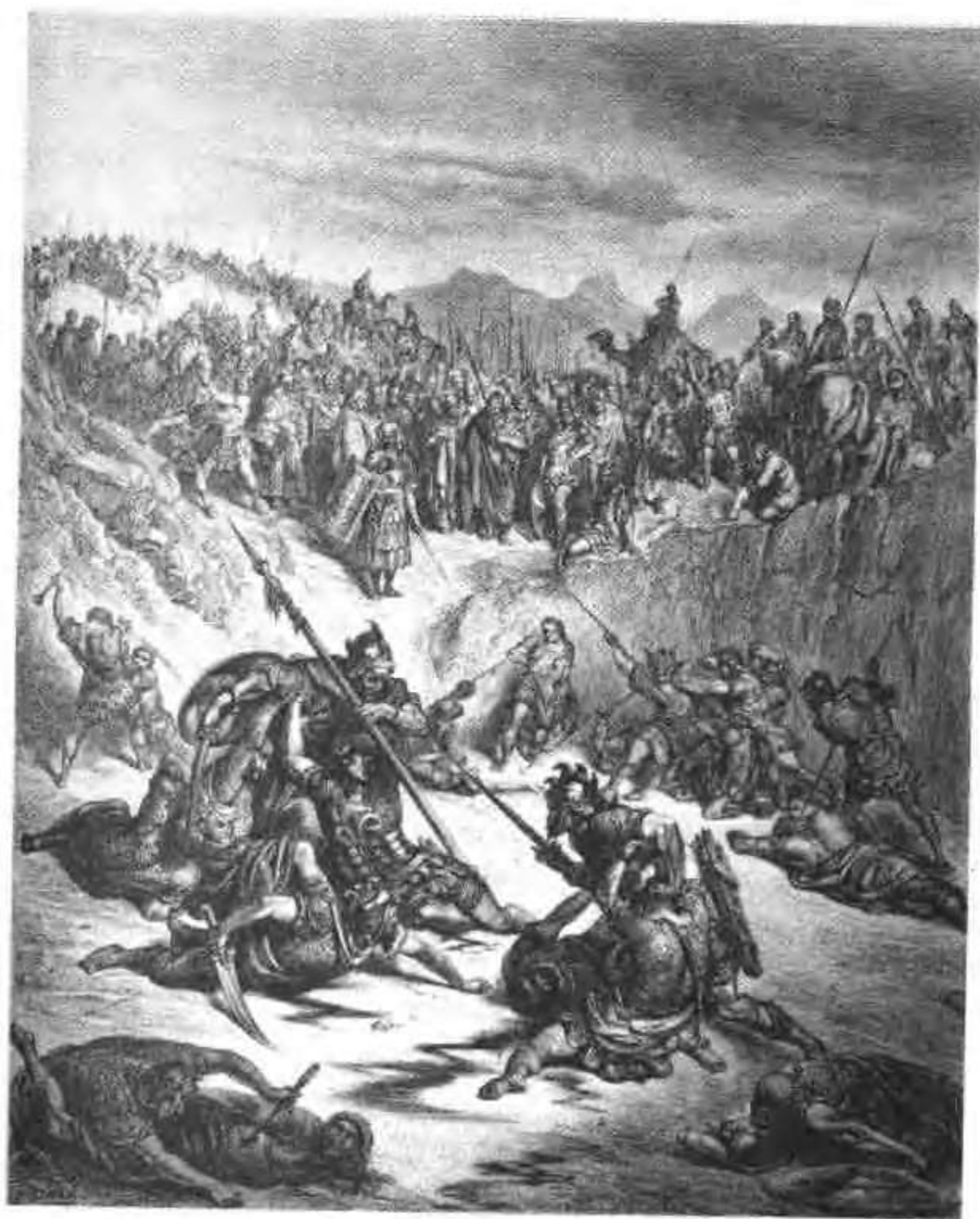
大卫与伊施波设的便雅悯人作战。