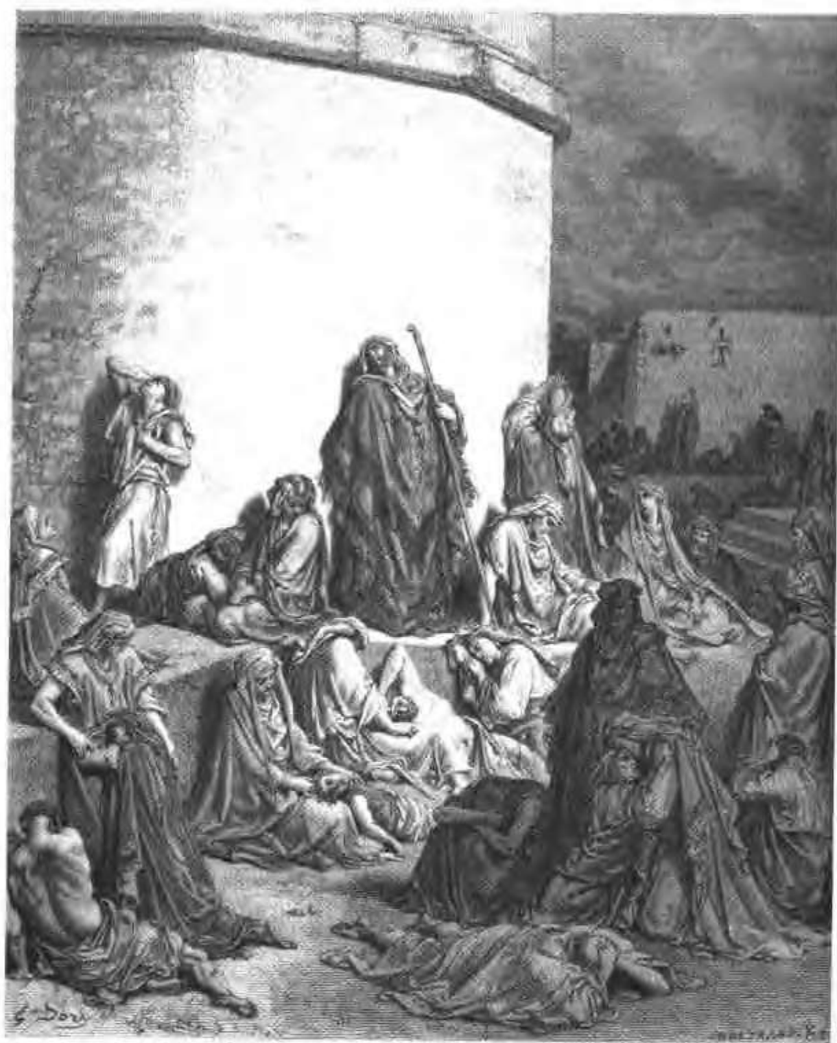
人们为耶路撒冷的衰败而哀伤。