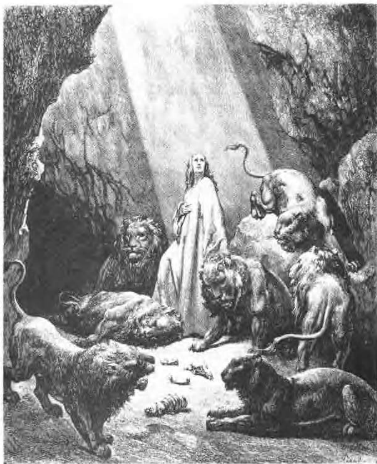
但以理在獅子坑中。